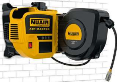
AIR MASTER 1.5 hp sin caldera. 160 lts./min. 230VII 8 bar. Sin aceite. 69 dB(A). Enrollador con 9 mts. de manguera.