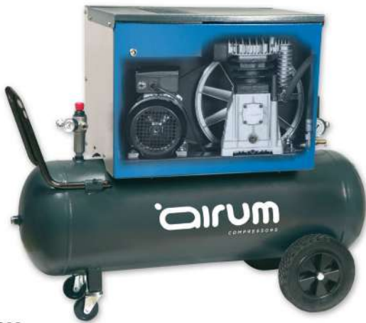
SILBOX B3800/100 CM3

Airum 3 hp caldera 100 lts. 390 lts./min. 220V II 10 bar, 69 dB(A).