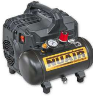
SILTEK + Nuair 1 hp caldera 6 lts. 105 lts./min. 59dB(A) 8 bar. Sin aceite.