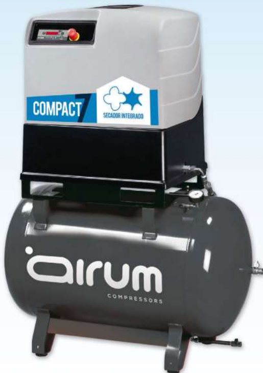
COMPACT 7-270 ES

Airum 10 hp caldera 270 lts. 1000 lts./min. 400V III 10 bar, 67 dB(A)