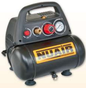
NEW VENTO 200/8/6 Nuair 1.5 hp caldera 6 lts. 180 lts./min. 8 bar. Sin aceite.