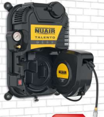
TALENTO 1.5 hp. Caldera 2 lts. 160 lts./min. 230VII 8 bar. Sin aceite. 69 dB(A). Enrollador con 9 mts. de manguera.